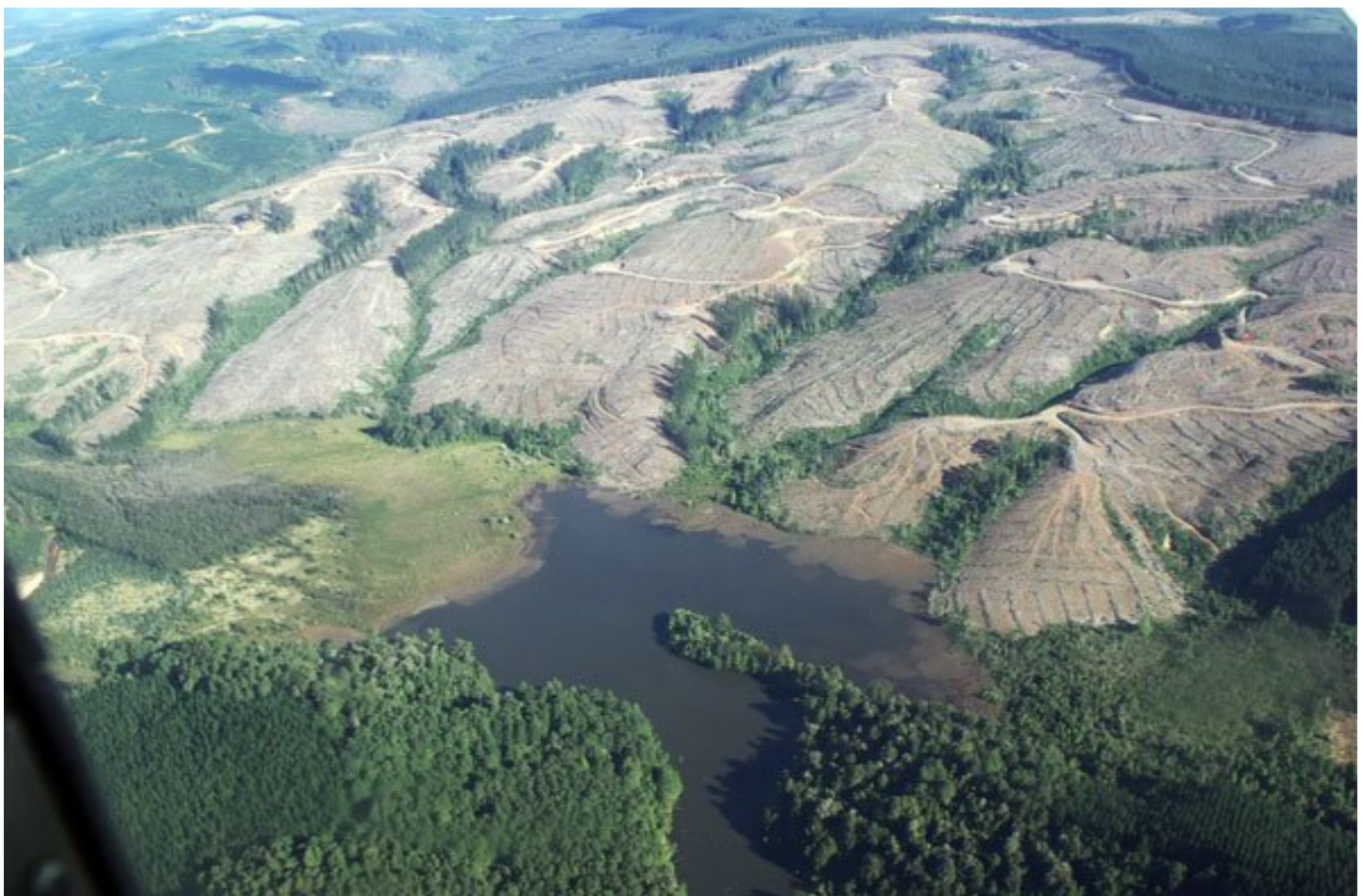
El modelo forestal basado en extensas plantaciones de monocultivo de especies exóticas: factor de sequía, degradación del suelo, desertificación.