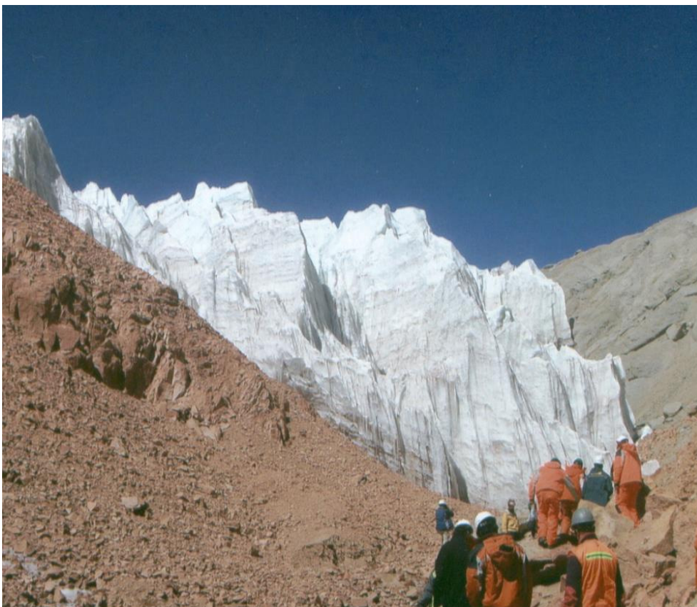
GLACIAR GUANACO.

En general, a nivel latinoamericano existe un vacío legal y de políticas públicas en relación a la conservación de estos recursos. Son 7 los países de América del Sur que cuentan con glaciares dentro de sus territorios, sin embargo hasta ahora ninguno ha tenido un marco jurídico donde se establezca la protección de las masas de hielo.