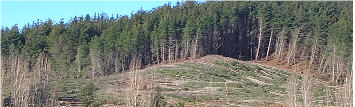
Plantaciones forestales en la región del Bio Bio.

Jamás se ha visto un copihue (la flor nacional que crece en los bosques nativos) en una plantación de pinos o de eucaliptus, porque el país al que hemos brindado y llamado Chile durante toda esta semana, hace tiempo que ha dejado de brotar en las políticas públicas. Por eso, ante la nueva fórmula denominada decreto 702 (Modificación a la Ley de Fomento Forestal), que pretende seguir dando sustento legal a un criminal modelo forestal, declaramos: