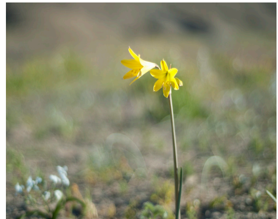
Un triunfo de las comunidades de las tierras áridas.