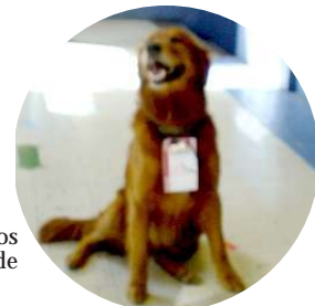
"Todos acreditados como corresponde al foro"

El OLCA no podía estar ausente, por esta razón organizó dos seminarios que contaron con una masiva participación de público, el primero estuvo dedicado a la preocupación de la "Producción Intensiva de Alimentos, Implicancias en la Soberanía Alimentaria y los Derechos de los Consumidores". Que contó entre sus panelistas con los representantes de: Rapal-Chile, ODECU, Ecocéanos y Greenpeace. Cada uno de ellos manifestó su preocupación por lo que está ocurriendo con los alimentos que llegan a nuestros hogares y que son ingeridos por toda la familia, se habla de pesticidas, desertificación del mar, derechos de los consumidores y derechos de los